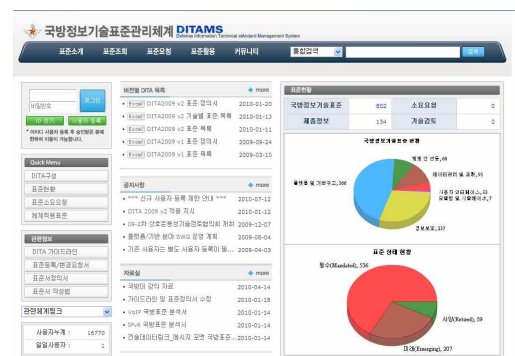
< 그림 2 > DITAMS 초기화면

DITAMS는 체계를 개발하는 기관 및 업체가 DITA에 근거하여 산출물을 개발할 수 있도록 인터넷 망으로 서비스 하고 있으며, 지상전술C4I, KJCCS, MIMS, 장비정비정보체계 등이 이를 활용하여 개발하였다.