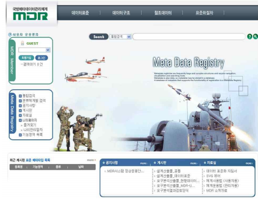
< 그림 3 > MDR 화면

대폭 확대하여 제공함으로써 개발 시 융통성을 향상시켜야하는데 이는 전장에서 다양한 요구를 수용하기 위해서는 더 많은 표준 단어, 도메인, 코드를 정의하고 제공할 기능이다. 예를 들면 부대종류와 규모 측면에서 보면 각종 훈련과 연습 시 새로운 부대가 창설되면 명칭이 추가로 필요 할 것이고 부대규모에 대한 표현도 대부분에서 소부대까지 세분화가 필요하며, 특히 연합작전을 고려 시 다양하게 표현하기위한 사전 정의와 표준이 필요하기 때문이며 또한 소프트웨어가 용도에 따라 다양한 종류로 개발이 요구됨에 따라 단어, 도메인, 코드는 확장이 필요하다고 생각된다.